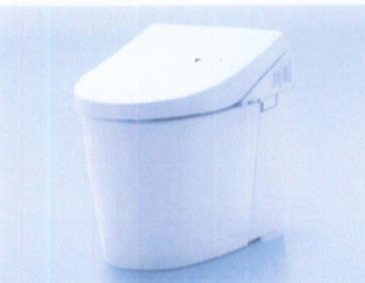
ネオレストAH 希望小売価格 334,000円(税・工事費別)