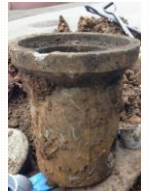
こちらがその コンクリート樹