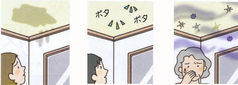
天井や壁にシミ 強雨時にポタポタ音 雨のあと、カビ臭い